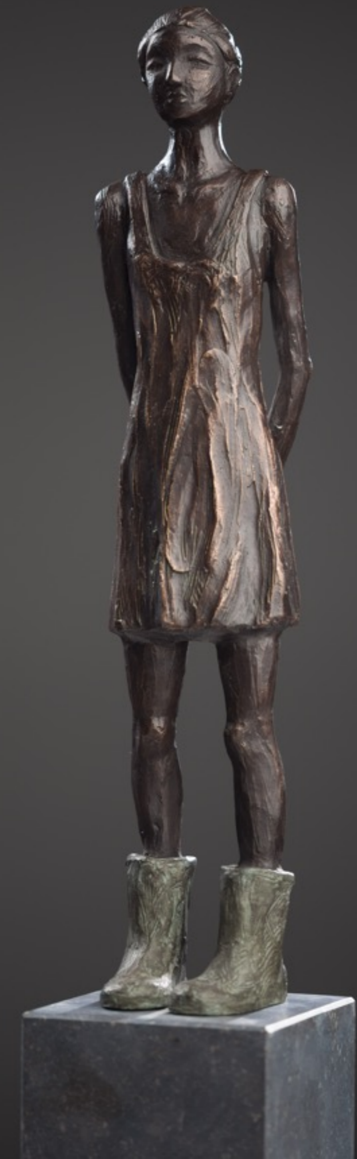
Schetsontwerp in brons