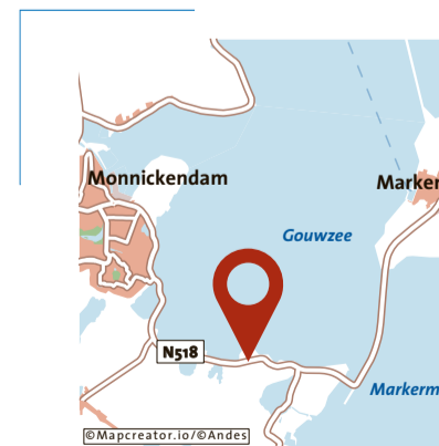
Locatie waar Tamar werd aange- troffen in de nacht van 24 op 25 juli.

In de nacht van vrijdag 24 juli op zaterdag 25 juli 2020 wordt de 14-jarige Tamar uit Marken doodgeregend op de Waterlandse Zeedijk tussen Monnickendam en Marken. Volgens het onderzoek was ze op slag dood. Op 7 augustus wordt een grijze Mazda 3 in Duitsland in beslag genomen en op 9 september verhoort de politie de bestuurder, een 28-jarige man die in Duitsland verblijft.