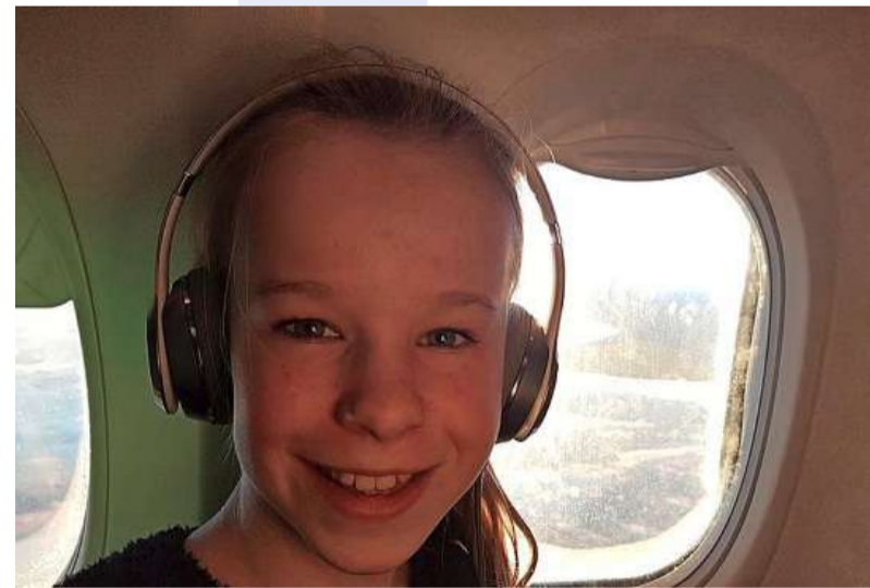
In het vliegtuig tijdens een stedentrip, Valencia 2017-2018.